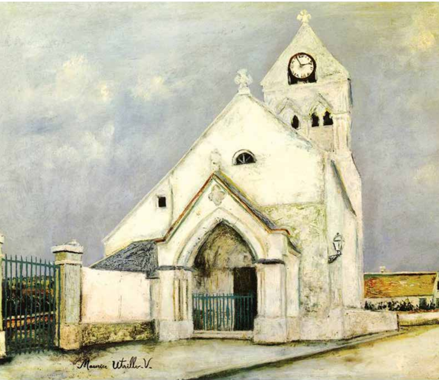
（法国）莫里斯·尤特里罗《蒙马特的教堂》1907—1910 年

《蒙马特的教堂》这幅作品中，白色色块与周围灰色色块形成强烈对比，物体的形状概括成简单的几何形状，并与近处的两根线条相交，构成画面运动的气势。