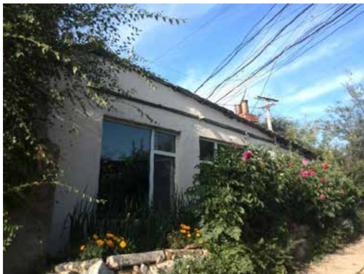
实景图片