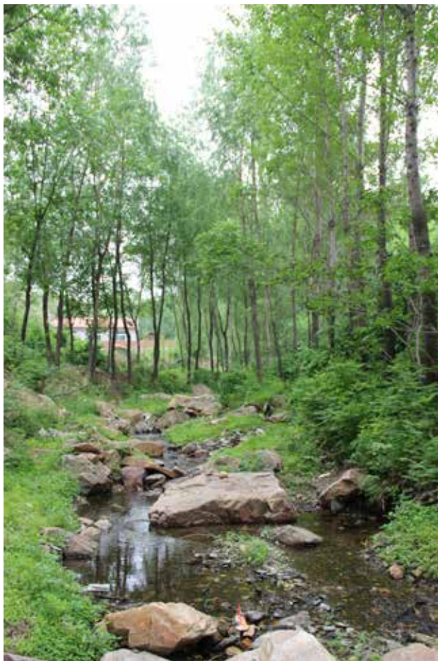
实景图片

色彩的处理也是进行取景选择的过程。根据实景对色彩的明度、纯度、色性、色相进行组织、归纳、剪裁、想象、夸张。这幅作品扩大了色彩表现力，压缩了明暗，加强了色块形状，使色彩对比更加单纯。