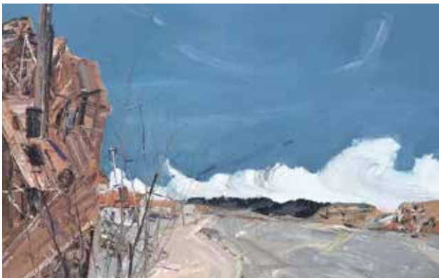
杨波《有砖厂的风景线》亚麻布油画 120cm×100cm 2016年

要想使你最后完成的作品在构图上有生气、有生命力，就必须强化构图的“势”，要有运动势态，这种势态是你在写生之前就已经在头脑中设计好的，它起源于你对画面中各种对比关系的处理技巧。