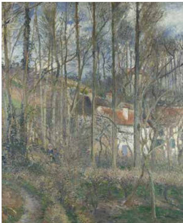
毕沙罗《庞图瓦兹，公牛斜坡》亚麻布油画 116cm×88.5cm 1877 年

贯彻整个构图的要素反复出现，会加强画面的整体性。《庞图瓦兹，公牛斜坡》这幅作品中，树木形成的垂直线反复出现，形成错落有致的空间关系。