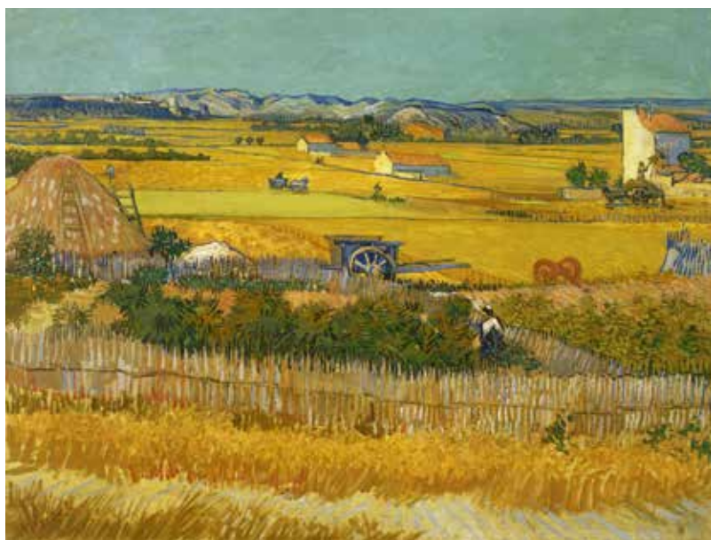
梵高《布格罗的收获风景》 亚麻布油画 72.5cm×92cm 1888年

《在圣·维克多山前的房舍》这幅作品更多地拘泥于客观物象，为了加强更多的主观、真实的感受而歪曲形状，物体形状概括成不规则的几何形状，富有韵律的线把色块串联起来。色彩也更加概括，表现在亮色块（暖色）与暗色块（冷色）井然有序地分布，构图上更注重画面的秩序感及线的韵律感，比印象派更加理性。