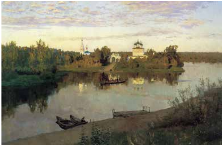
（俄罗斯）列维坦《晚钟》亚麻布油画 87cm×107.6cm 1892 年，现藏于莫斯科特列恰科夫美术博物馆

画面的变化，体现在色彩构成上，地面柔和的暖灰色调与天空明亮的蓝紫色形成强烈的冷暖对比。近处的深土绿与橄榄绿形成的重色块与远处城堡明亮的黄色色块又形成画面的一个视觉明度对比。