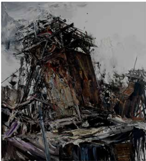
郑海标 副教授《八里坡小景之三》亚麻布油画 100cm×160cm 2016年

《八里坡小景之三》这幅作品色彩单纯，画面黑、白、灰关系处理得极其肯定、熟练，充满了强烈的视觉张力。中间的金属架子属于视觉的中心，也是构图中所有形式要素的交合点，是形式构成过程中最终要达到的高潮。画家满怀激情地重点塑造了此处，是构图中最引人入胜的地方。