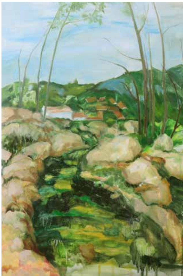
全玲《水芳潋滟晴方好》 油画 60cm × 80cm