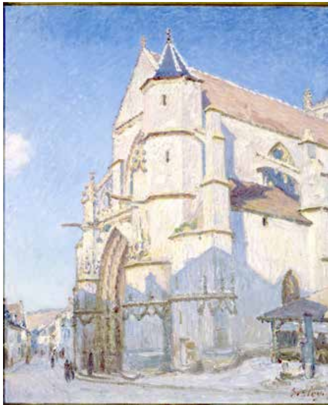
西斯莱《莫雷的教堂》亚麻布油画 100cm×81cm 1894 年