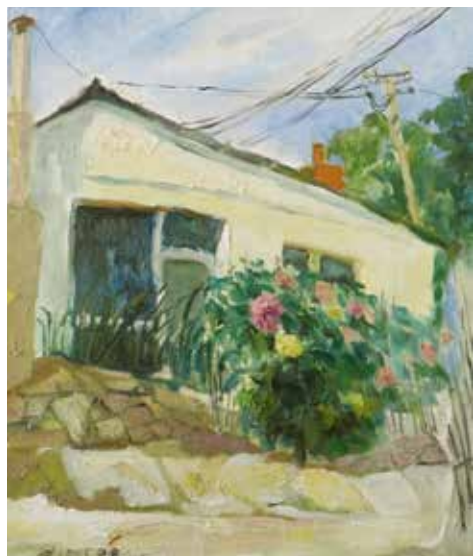
全玲《大丽花》 油画 33cm × 45cm