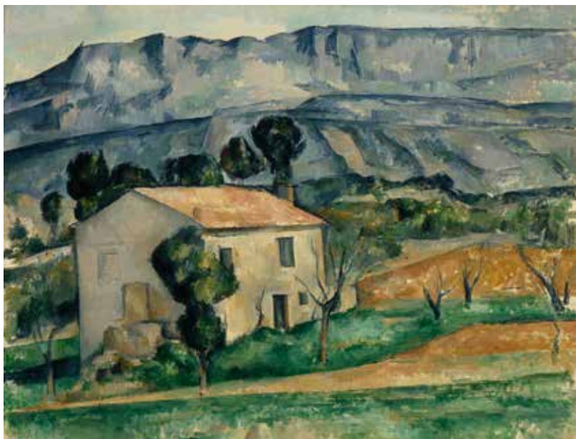
塞尚《在圣·维克多山前的房舍》 布面油画，65.6cm×81.3cm 1886—1890年，现藏于印第安纳 波里斯美术馆

《在圣·维克多山前的房舍》这幅作品更多地拘泥于客观物象，为了加强更多的主观、真实的感受而歪曲形状，物体形状概括成不规则的几何形状，富有韵律的线把色块串联起来。色彩也更加概括，表现在亮色块（暖色）与暗色块（冷色）井然有序地分布，构图上更注重画面的秩序感及线的韵律感，比印象派更加理性。