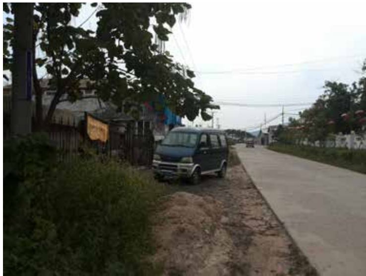
实景照片