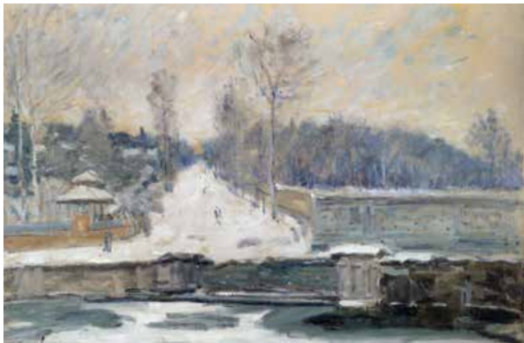
（法国）西斯莱《马利的水塘》 亚麻布油画 56cm×65.5cm 1875 年

《马利的水塘》这幅作品运用非对称平衡方式，将视觉重量相似的要素用几何形态把色块联系起来。