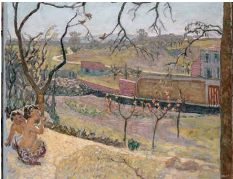
博纳尔《早春》布面油画 102.5cm × 125cm 1909 年

《早春》这幅作品的构图呈现出倾斜的视角，像截取片断似的场景。冷色块与暖色块穿插设计，通过减弱投影，加强色彩的明度对比，使平面空间富于变化。