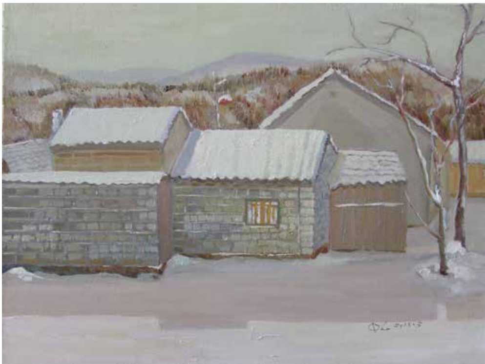
全玲《家园》油画 70cm×80cm 2013年

《家园》这幅作品在构成上舍弃了一些影响整体的细枝末节，加强了点、线、面的视觉转换，把繁琐的物象进行简化，不追求近大远小和立体的科学视觉原理，避免过多空间的介入。在画法上也多采用平涂法，充分利用物象平面化之后的厚度感觉构建出静穆的氛围。