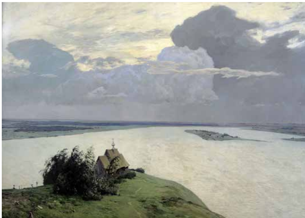
（俄罗斯）列维坦《墓地上空》又译：《在永恒的安宁之上》 亚麻布油画 150cm×206cm 1894 年，莫斯科特列恰科夫美术博物馆

在《墓地上空》这幅作品中，近处的树木和房屋是引人注意的亮点，而开阔简单的远景对它有抑制作用。