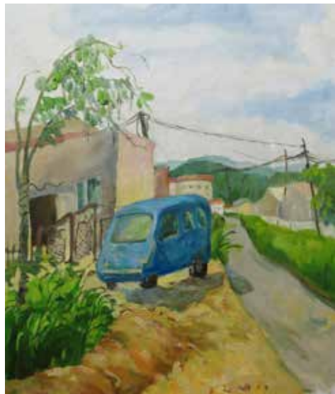
全玲《暖暖的金秋》 油画 41cm × 53cm