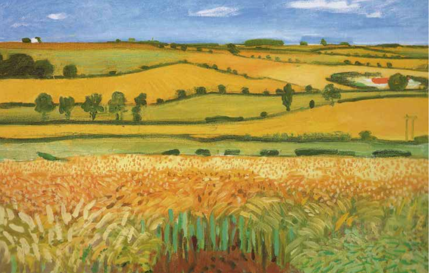
（英国）大卫·霍克尼《woldgate viste》布面油画 2005 年 艺术家自藏

《Woldgate viste》这幅作品的设计意味浓重，精心设计了一个决定画面分割的大框架——麦田，被设置于中景，故意避免了远景的出现。框架采用简单明确的接近各类几何形的形状，显现出极强的艺术感染力。近景清晰的笔触丰富了画面的语言。