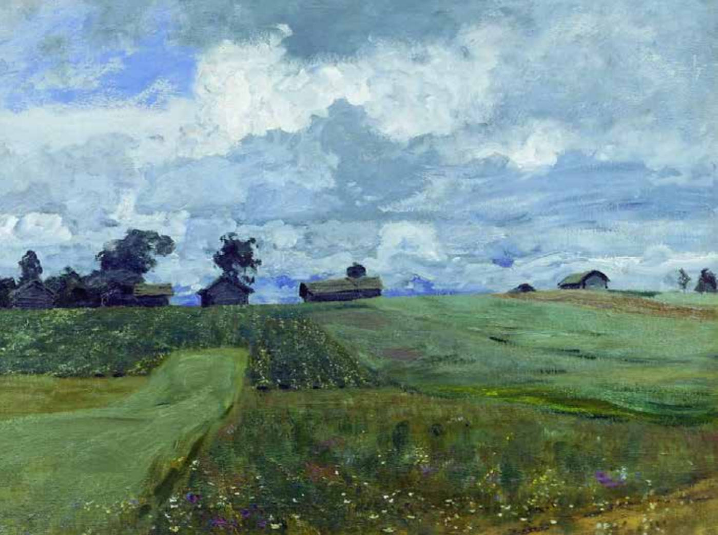
列维坦《暴风雨》亚麻布油画

列维坦是 19 世纪俄罗斯最杰出的风景画大师之一。他创造的《暴风雨》这幅作品，用抒情的笔调描绘暴风雨来临之前的田野和天空。