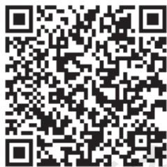
想吃苹果的鼠小弟

(1) 观看“想吃苹果的鼠小弟”视频，结合视频及教案内容讨论问题：幼儿园语言教育活动的过程一般分哪些步骤？幼儿园语言教育活动的�基本方法有哪些？幼儿园语言教育活动的组织要点有哪些？在组织教育活动中，可能会出现哪些问题？你会用什么方法处理？将讨论的结果填入工作表单（见表3-1-1-1）中。