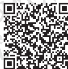
幼儿园安全教育工作