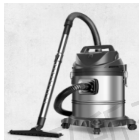
图 1-2 吸尘器