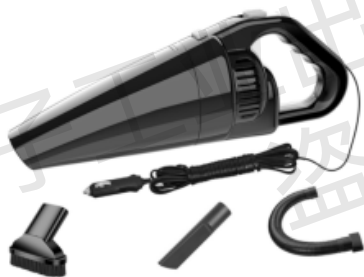
图 1-3 车载吸尘器