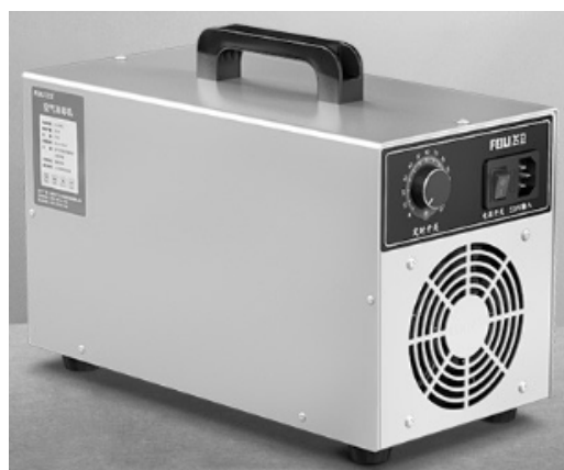
图 1-7 汽车臭氧消毒机