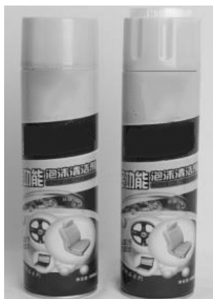
图 1-11 多功能泡沫清洁剂