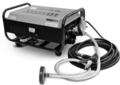
图 1-1 高压清洗机