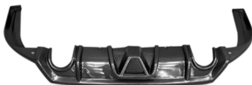
图 1-15 扰流板