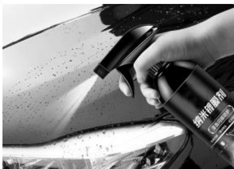
图 1-12 镀膜剂