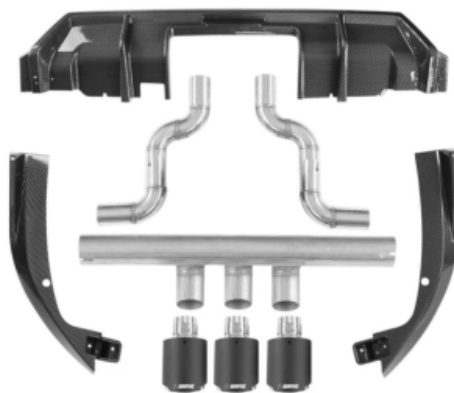
图 1-16 碳纤维尾喉+扰流板+护角