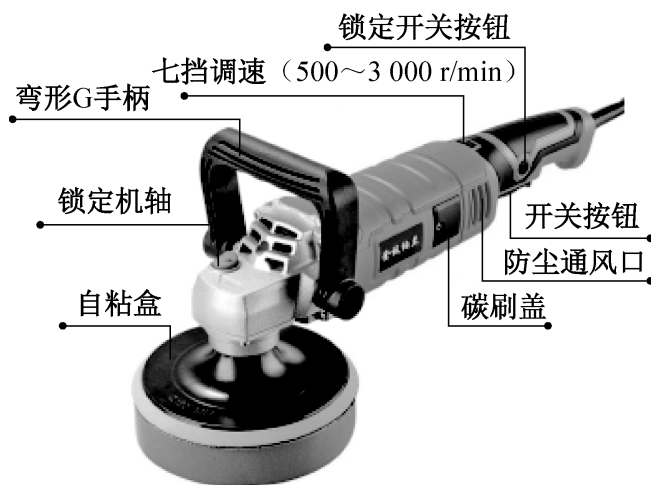
图 1-5 抛光机