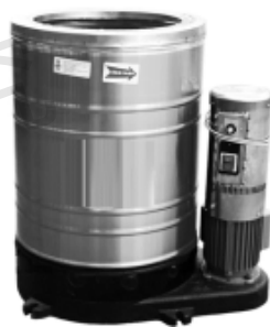
图 1-4 脱水机