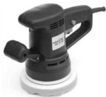
图 1-6 封釉机