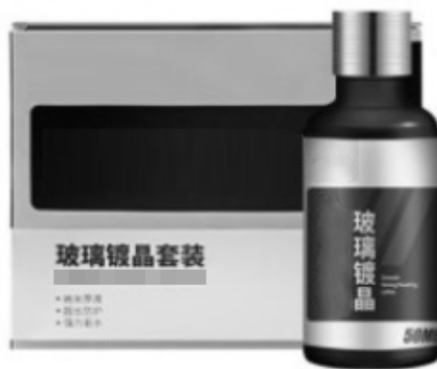
图 1-10 镀晶套装