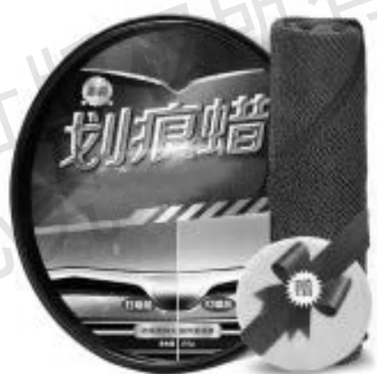
图 1-9 划痕蜡