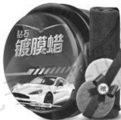
图 1-8 镀膜蜡