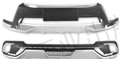
图 1-13 前保险杠装饰件