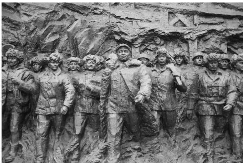
图 3-2-1 王进喜

中华人民共和国成立后，面对积贫积弱、百废待兴的局面，为了迅速恢复和发展国民经济，党和国家号召工人阶级和广大人民群众向为革命事业作出伟大贡献的先进模范学习，积极投身于经济建设之中。1950年9月，全国工农兵劳动模范代表会议召开，400多名全国工农兵劳动模范代表出席了会议。此后，《关于全国工农兵劳动模范代表会议的总结报告》提出，“要把评选劳模形成固定的制度”。这对劳模精神的弘扬有着重要的历史启示。孟泰就是中华人民共和国成立初期涌现出的劳动模范。他组织人员进行联合攻关，先后解决了十几项技术难题，成功制成大型轧辊，填补了我国冶金史上的空白。进入全面建设社会主义时期后，全国各条战线上涌现出了大批劳动模范人物。大庆石油工人“铁人”王进喜（见图3-2-1）、党的好干部焦裕禄、解放军好战士雷锋就是其中的典型代表。1960年，王进喜率领钻井队到大庆参加石油大会战，组织全队职工用“人拉肩扛”的方法搬运和安装钻机，用“盆端桶提”的办法运送钻机用水，使大庆油田的第一口油井得以提前开钻。当井喷的险情发生时，王进喜不顾腿伤，带头跳进泥浆池，用身体搅拌泥浆，控制住了井喷，并因此获得了“铁人”的荣誉称号。